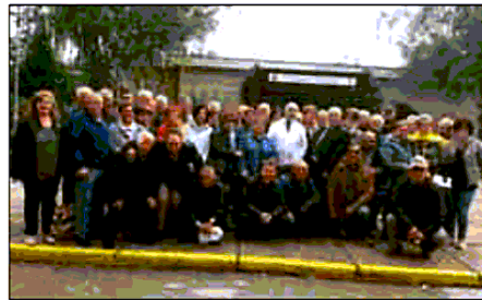
Il convegno con Federanziani alle Terme di Latronico

vorò ha già messo in campo una serie di progetti vincenti e virtuosi che ne fanno un'eccellenza territoriale - aggiunge - ci sono alcune note fin dalla preistoria, a testimoniarlo sono le grotte di Calda, dove gli archeologi ad inizio del secolo scorso hanno trovato elementi votivi, presso le sorgenti, luoghi sacri connessi con il culto delle acque salutari. A seconda delle patologie le Terme Lucane offrono una serie di cicli terapeutici in grado di garantire benefici per osteoar-