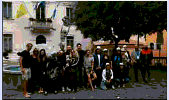
La visita di gruppo nel centro e nella Grotta delle Meraviglie con i vip