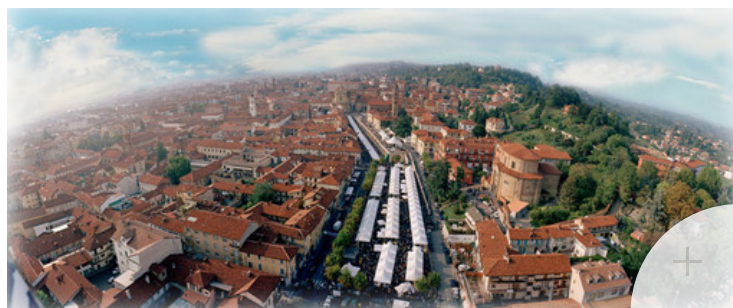
Immagine di repertorio

Convegno in programma venerdì 19 gennaio, alle 16, presso l'Auditorium "G.Arpio"